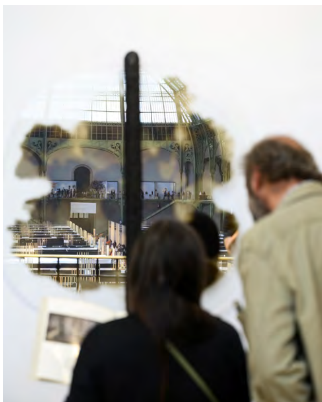
YONZ STUDIO - RÉVÉLATIONS 2025