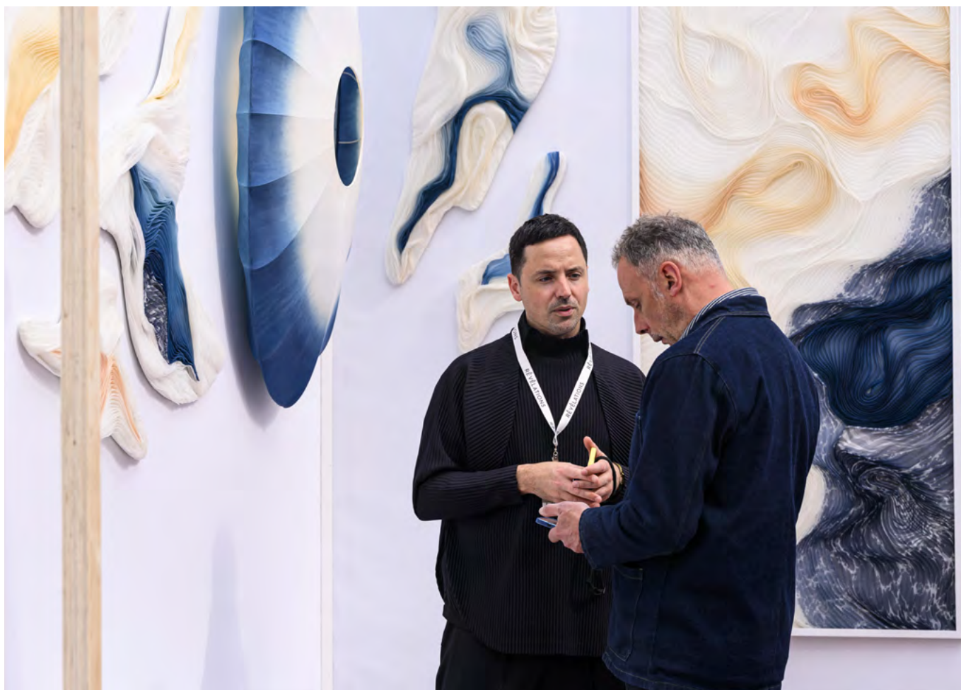
ATELIER SUMBIOISIS - RÉVÉLATIONS 2025