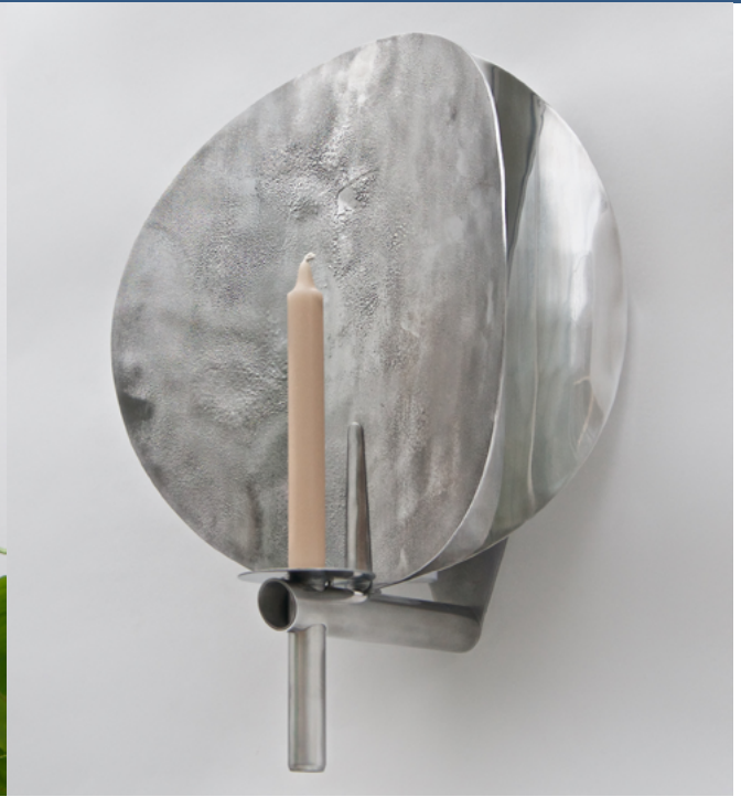
APPLIQUE S'CFR © MARION MEZENGE